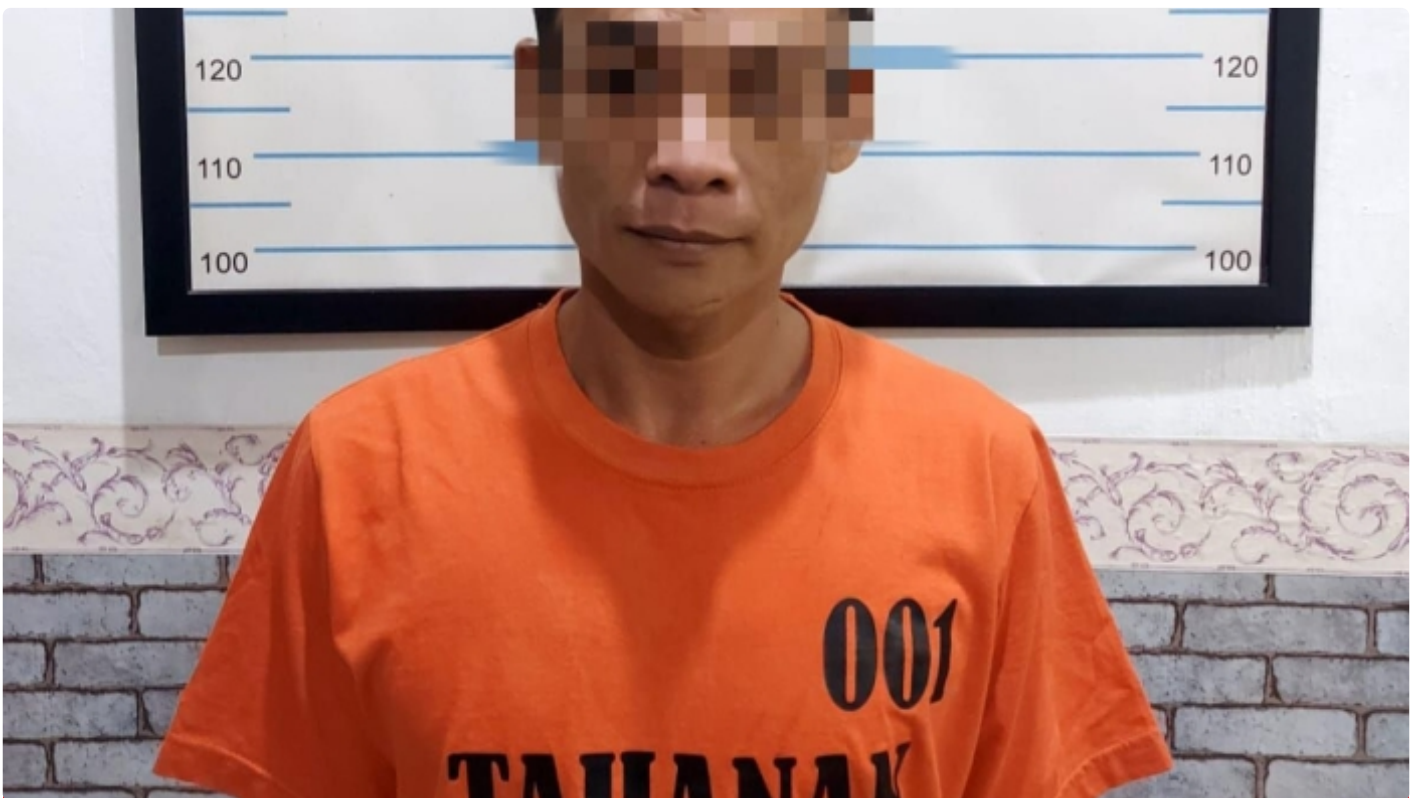
Tersangka SY Diamankan Satnarkoba Polres HST beserta Barang Bukti

Polres Hulu Sungai Tengah Polda Kalimantan Selatan - Satuan Resnarkoba HST, berhasil meringkus tersangka SY, 38 Tahun, Laki-laki, Wiraswasta, SMA, Jln. Batuah rt 003 rw 002 Desa Pandawan Kec. Pandawan Kab. HST ( sesuai KTP ) yang diduga sebagai penyalahgunaan narkotika jenis sabu-sabu. Minggu (8/1/2023) skj 22.15 wita